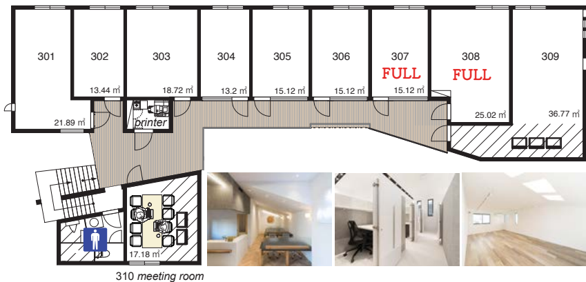
310 meeting room